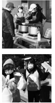
避難生活をしている近隣の方々に、暖かい食事を届ける職員の様子。