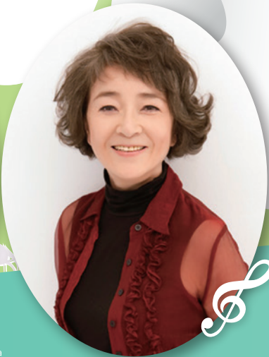
倍賞 千恵子 (女優)