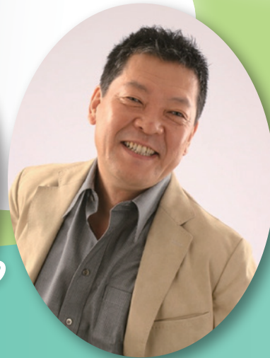
小六 禮次郎 (作曲家)