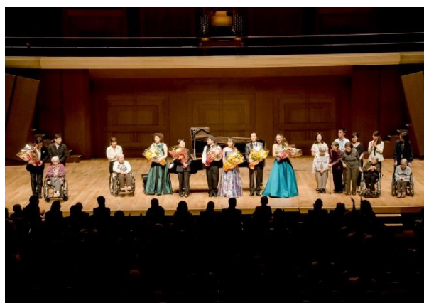
最後は、出演者と来場者全員で“ふるさと”を合唱