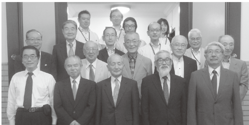
後援会役員会にて