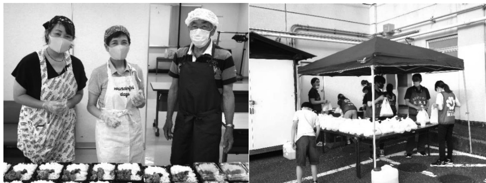
～清風園～ にこにこ清風ワゴン

新型コロナ禍で、多くの地域活動やボランティア活動を休止せざるを得ない状況がありますが、そうした中でも工夫を重ねながら継続、或いは再開している活動をいくつかご紹介します。