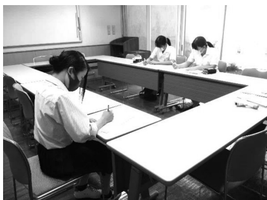
～相良清風園～ お手紙ボランティア

「こども食堂」は、施設内の会食を避け、中学校の校庭をお借りしてお弁当を配っています。