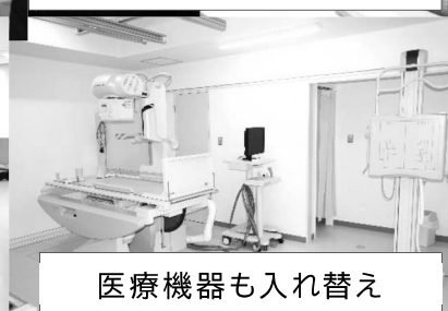
医療機器も入れ替え