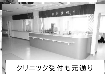
クリニック受付も元通り