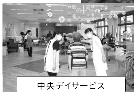
中央デイサービス