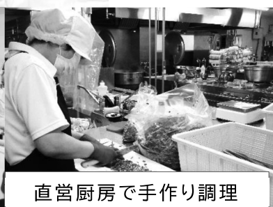
直営厨房で手作り調理